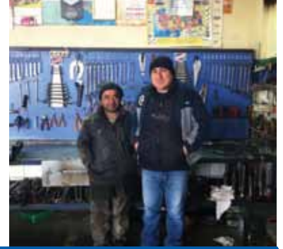
METE DİZEL OTO BAKIM SERVİSİ BMC-FORD-CHRYSLER İNEGÖL