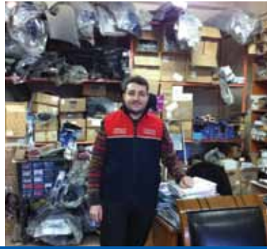
OTO UZLAR FORD-BMC CHREYSLER İNEGÖL