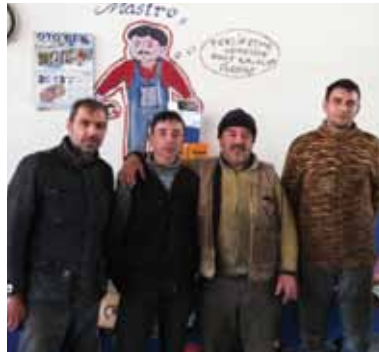
ŞEÇKİN ÖZEL TAMİR VE BAKIM SERVİSİ MERCEDES MAN İNEGÖL