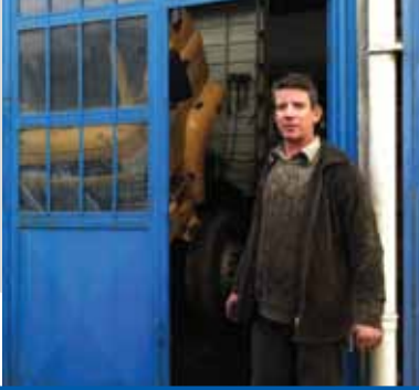
KIZILKAYA OTO TAMİR BMC-FORD İNEGÖL