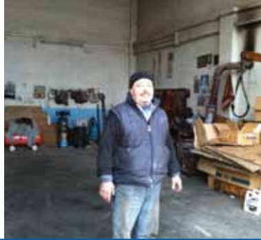
BOLU DİZEL TAMİR BAKIM SERVİSİ BMC-FORD İNEGÖL