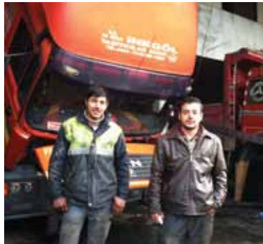
GENÇLER OTO MAN-MERCEDES-DAF MITSUBISHI İNEGÖL