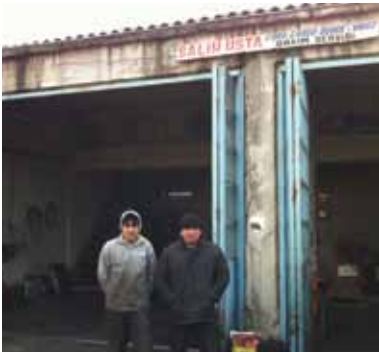
SALİH USTA BAKIM SERVİSİ BMC-CHRYSLER-FORD GEMLİK