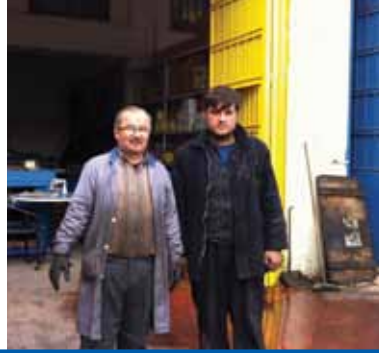
KOÇ HİDROLİK BMC CHRYSLER-FORD-MERCEDES GEMLİK