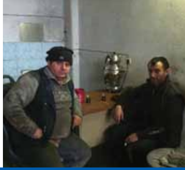
İNEGÖL DİZEL BMC-CHRYSLER FORD-MERCEDES İNEGÖL