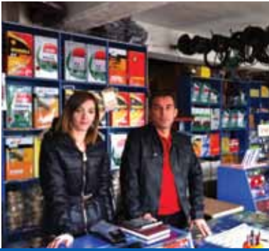
OTO CİHAN BMC-FORD MERCEDES-MAN-DAF-VOLVO SCANIA GEMLİK