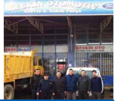
KESKİN OTOMOTİV MAN MERCEDES-VOLVO-RENAULT SCANIA-BMC-IVECO-DAF İNEGÖL