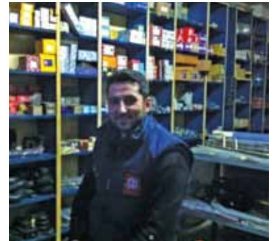
SERDAROĞLU OTO YEDEK PARÇA BMC-FORD İNEGÖL