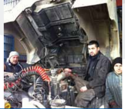
EMİNOĞLU BMC ÖZEL BAKIM SERVİSİ GEMLİK