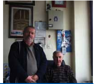
ÖZSARAÇLAR OTOMOTİV BMC-FORD-MERCEDES İNEGÖL