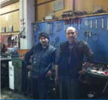
ANKARALI TAMİR BAKIM SERVİSİ BMC-FORD İNEGÖL