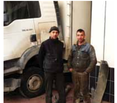
GÜVEN OTOMOTİV BMC-FORD-CHRYSLER MERCEDES-MAN İNEGÖL